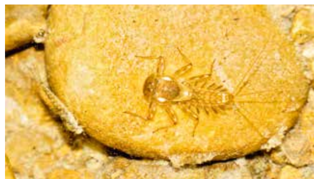
En haut, la larve de l'éphéméroptère Ecdyonurus sp. ; en bas, la femelle du plécoptère Brachyptera risi .

L'amélioration de la naturalité n'est qu'une des exigences formulées par rapport à la qualité de nos cours d'eau. L'exploitation d'énergie propre et la protection contre les dommages dus aux crues nécessite également des infrastructures techniques. Lorsqu'une telle intervention conduit à une atteinte au cours d'eau, celle-ci doit être compensée. Les cours d'eau sont des milieux protégés par la loi, et les autorités responsables de la protection de la nature doivent donc décider si les mesures prévues lors d'un projet sont suffisantes. Une nouvelle méthode doit aider à évaluer les mesures de compensation. Les trois bureaux Limnex, SigmaPlan et Hintermann & Weber développent ensemble cette méthode pour le compte du canton de Berne. La méthode de bilan déjà existante, pour les milieux terrestres, en est la base. Le principe de base et les « points écologiques » en sont repris. Des critères supplémentaires, pertinents pour les cours d'eau, tels que l'écomorphologie, l'hydrologie, la biocénose des organismes aquatiques et la continuité nécessaire au déplacement des poissons y sont intégrés. D'ici la fin de l'année, une méthode pour l'utilisation pratique devrait être disponible.