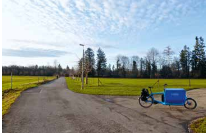
Circuler dans le parc paysager de la Wiese en infomobile .

D'un jour à l'autre, des rangers ont donc commencé à patrouiller à travers le parc. Tout à coup on se sent observé. Comment éviter de heurter le public ? Cela nécessite beaucoup d'entregent et d'intuition. Le démarrage du projet a donc été préparé avec soin. Un événement médiatique et un week-end d'infor-