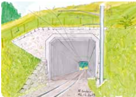
Illustration du futur portail du Tunnel des Gîtes. (Illustration : N. Graber).

Le MOB procède actuellement à l'assainissement de plusieurs ouvrages sur sa ligne. Le tunnel des Gîtes, près d'Allières, en fait partie. Le tunnel existant sera remplacé par une tranchée couverte. Nous nous occupons de l'étude d'impact et de l'étude pédologique (MOB, Benoît Calcoen).