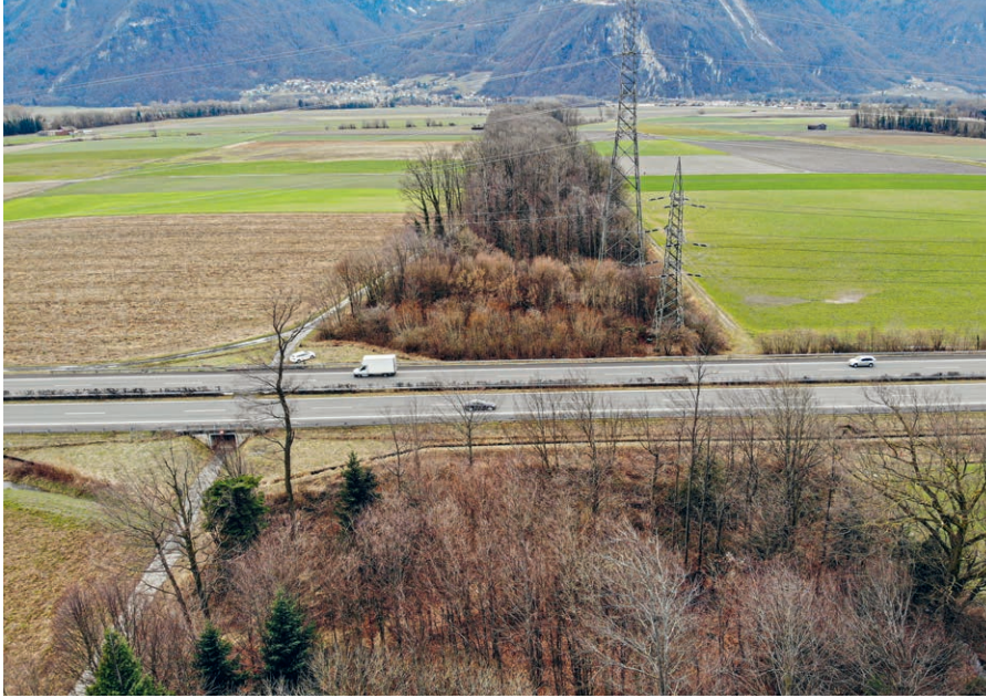
Die Wildtierbrücke soll den Gehölzstreifen, der die Rhoneebene im Chablais durchzieht, über die Autobahn hinweg verbinden.