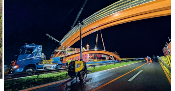
Anfang April 2026: Nach langen Vorarbeiten beiderseits der Autobahn nimmt die Passage Gestalt an.