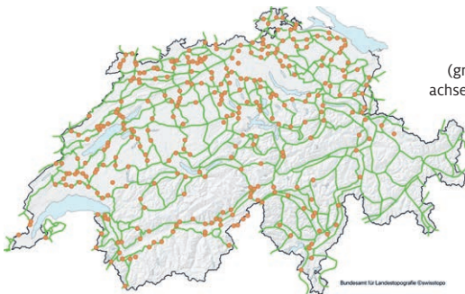
Das «Vernetzungssystem Wildtiere» durchquert die ganze Schweiz (grüne Linien = Nationale Verbindungsachsen, orange Punkte = Wildtierkorridore von überregionaler Bedeutung).