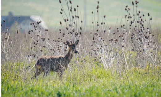
Rehe und andere wandernde Wildtiere suchen bei ihren Wanderungen Deckung.

→ Autobahnen – oft wirken aber auch kleinere Eingriffe. Wichtig ist, dass Tiere während ihrer Wanderung genügend ruhige Bereiche finden und sich orientieren können. Leitstrukturen wie Hecken, Brachen oder bestockte Fließgewässer führen Wildtiere zu geeigneten Querungsstellen. Auch technische Lösungen können helfen: Wildwarngeräte oder bessere Sicht entlang von Strassen sorgen dafür, dass Autofahrer:innen Tiere früher erkennen – und umgekehrt. Das senkt das Unfallrisiko. Wildunfälle verursachen jedes Jahr hohe Sachschäden und können für Menschen gefährlich sein. Die AXA schätzt den jährlichen Schaden auf über 11 Mio. Franken.