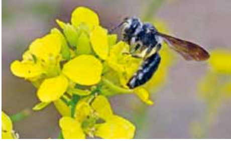
Abeille noire Andrena agillissima