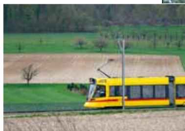
La ligne BLT n°10 avant la construction d'une deuxième voie (en haut). Chantier ferroviaire (à droite).

Grâce à une équipe de spécialistes dont les compétences se complètent, nous déclinons l'entier de la palette des savoir-faire nécessaires à l'élaboration des aspects environnementaux.