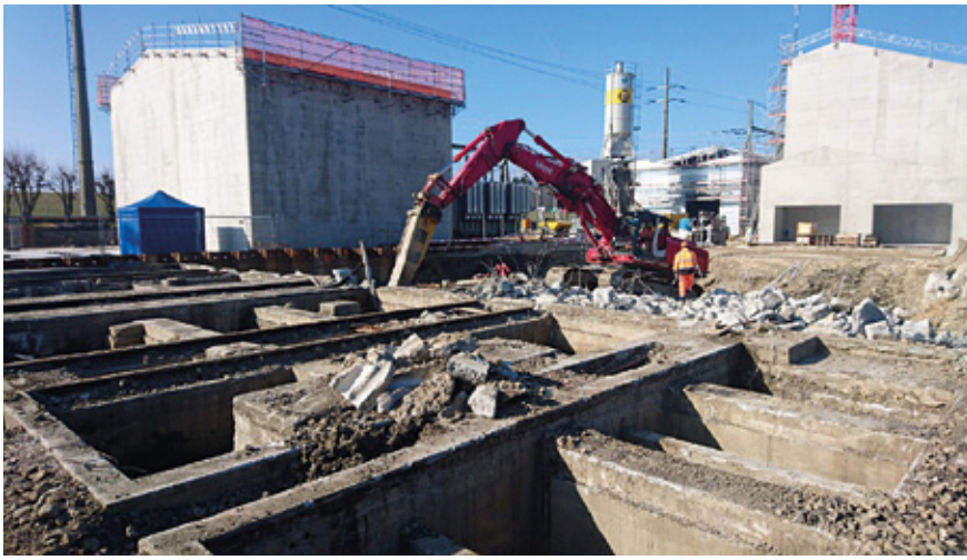
Travaux de déconstruction des installations existantes.