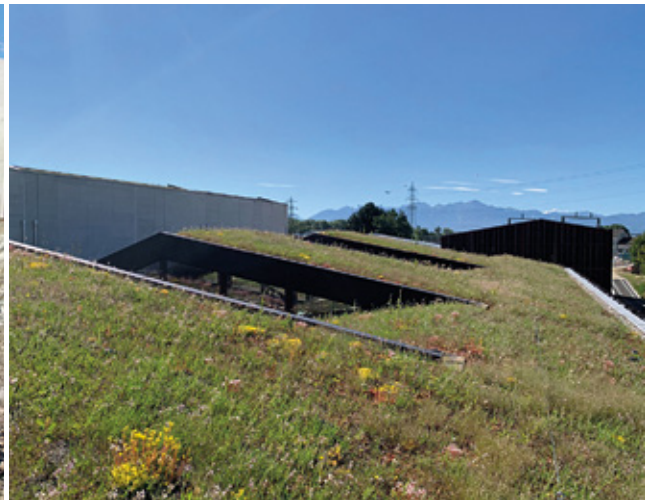
Toiture végétalisée du bâtiment GIS Swissgrid.