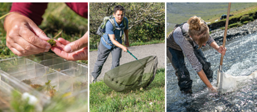
Travail de terrain des spécialistes des plantes vasculaires, des mousses, des papillons de jour et des insectes aquatiques.

Les données du MBD relevées depuis une bonne vingtaine d'années montrent que plusieurs événements se produisent :