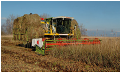
Fauchage des roseaux dans la Grande Cariçaie.

du conseil en matière d'entretien des zones humides.