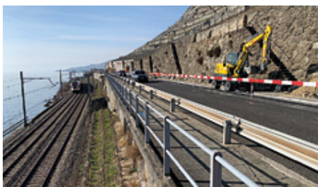
Une infrastructure stratégique située dans un contexte paysager sensible.

Les travaux, suivis par le bureau de Montreux, débutent ce printemps et sont planifiés jusqu'en 2025.